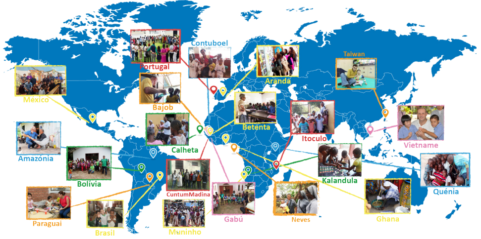
Em cima: Mapa com as Missões já divulgadas até agora na rubrica “Foto da Semana”

A Solsef continua a apostar nas redes sociais como forma de dar a conhecer o trabalho desenvolvido pelos parceiros locais no âmbito dos projetos de cooperação e voluntariado internacional. Assim, a iniciativa “Foto da Semana” surgiu como forma de divulgar o trabalho social desenvolvido pelas Missões Católicas e as histórias com as quais os voluntários se cruzam nos diversos projetos, apresentando-as sob o ponto de vista da EDCG.