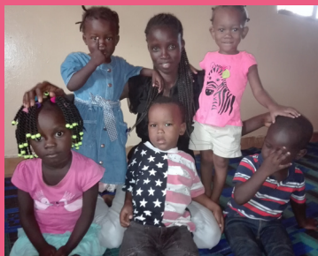
Em cima: Crianças do Jardim-Escola "São Pedro Apóstolo"

O valor angariado no Jantar de Natal de 2018 da Solsef, reverteu para o apoio ao Jardim-Escola São Pedro Apóstolo no Bairro da Ajuda (Guiné-Bissau), através da facilitação de bolsas de estudo para as educadoras e da aquisição de material didático. O Jardim-Escola é gerido pela CSSp em Bissau.