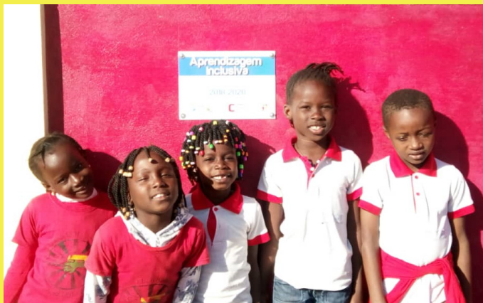
Em cima: Crianças do "Centro Educacional Irmã Valdelícia" diante do novo refeitório, construído no âmbito do projeto "Aprendizagem Inclusiva"

O projeto "Aprendizagem Inclusiva", que arrancou em outubro de 2018 e termina em maio de 2020, irá apoiar o desenvolvimento do Centro Educacional Irmã Valdelícia (CEIV) em Contuboeil (Guiné-Bissau). Na Fase I do projeto foram criadas infraestruturas de refeição (cozinha, despensa e refeitório escolares), para os 300 alunos da escola, bem como um aviário que será dinamizado por vários membros da comunidade que estão a frequentar a formação em "Iniciativas de Empreendedorismo Local". Na Fase II do projeto, a iniciar em agosto de 2019, será feito o reforço do currículo pedagógico das escolas da vila de Contuboeil para a integração de alunos/as com Necessidades Educativas Especiais, bem como a ampliação dos espaços recreativos e desportivos do CEIV. Este projeto resulta da parceria com a Congregação Santa Teresinha do Menino Jesus e conta com o cofinanciamento do Camões I.P.