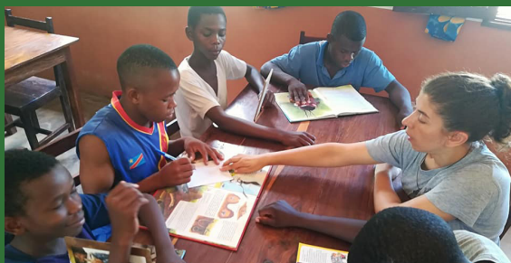
Em cima: Jovens do Lar Masculino de Estudantes "Beato Daniel Brottier"

Em 2019, a Solsef irá apoiar a abertura de um furo de água com bomba elétrica para o Lar Masculino de Estudantes "Beato Daniel Brottier", inaugurado em maio de 2016 no âmbito do projeto "Juntos na Aprendizagem". Gerido pela CSSp, este Lar irá acolher em 2019 um total de 48 jovens vindos das zonas mais interiores do Posto Administrativo de Itoculo. Assim sendo, os jovens encontram no Lar a única maneira de frequentar a Escola Secundária. O furo irá facilitar o acesso à água no Lar, melhorando não só as condições de higiene e saúde dos laristas, como também permitindo o cultivo de hortícolas para o abastecimento da despensa comum.