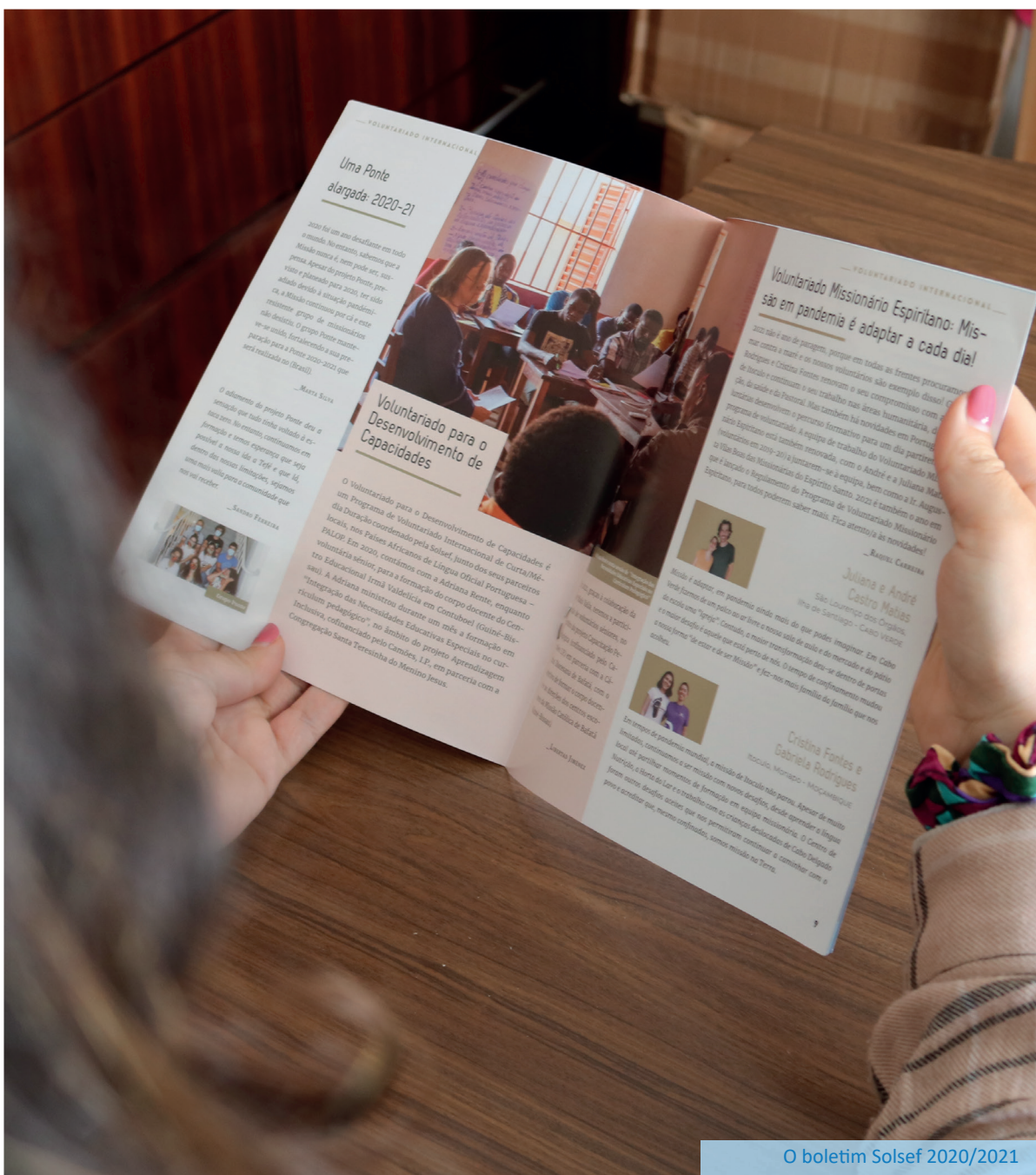
O boletim Solsef 2020/2021

Foi publicado o Boletim Anual com 16 páginas e 6000 tiragens, tendo sido um importante veículo de comunicação que foi enviado aos sócios por ocasião da convocatória para a 56a Assembleia Geral, e que serviu também para dar a conhecer a Solsef a novos públicos que contactaram com a associação, por forma a estimular a confiança e a reforçar a ligação.