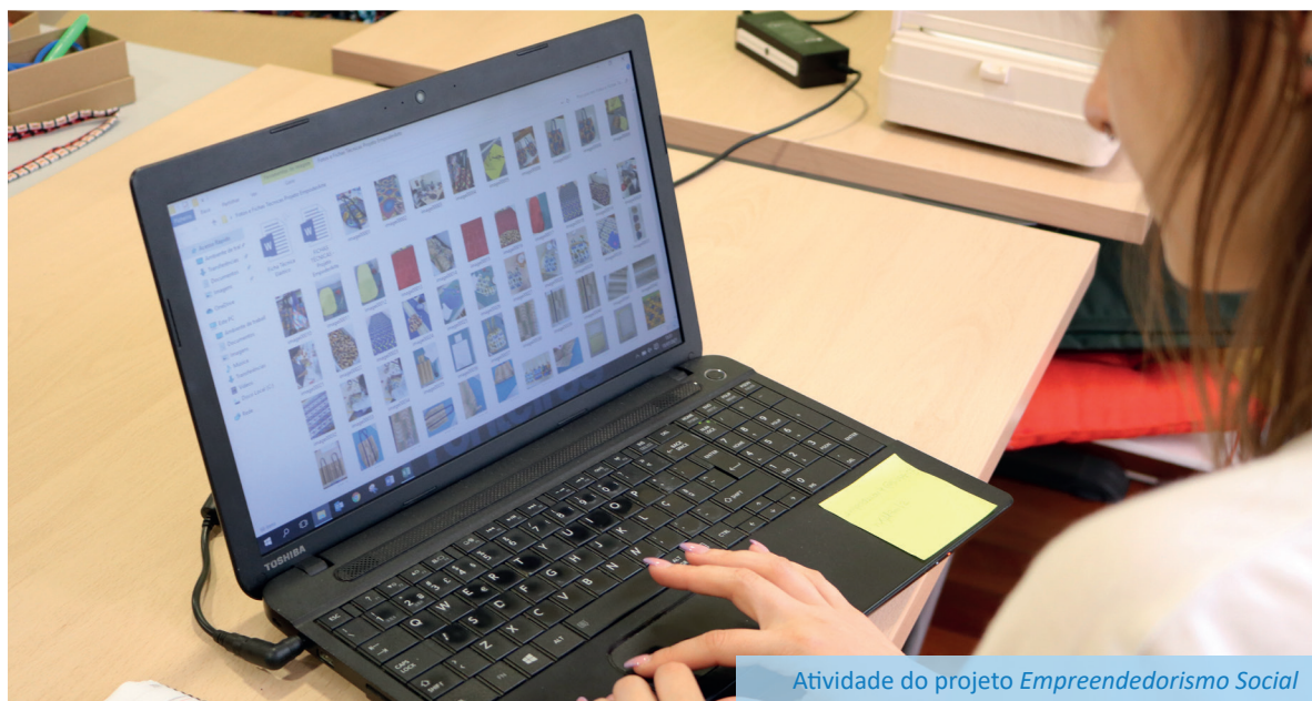
Atividade do projeto Empreendedorismo Social