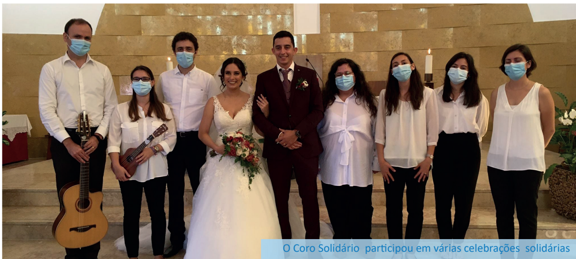
O Coro Solidário participou em várias celebrações solidárias

À semelhança de anos anteriores, ao longo de todo o ano surgiram também diversas angariações de fundos no Facebook, por ocasião de diversos aniversários.