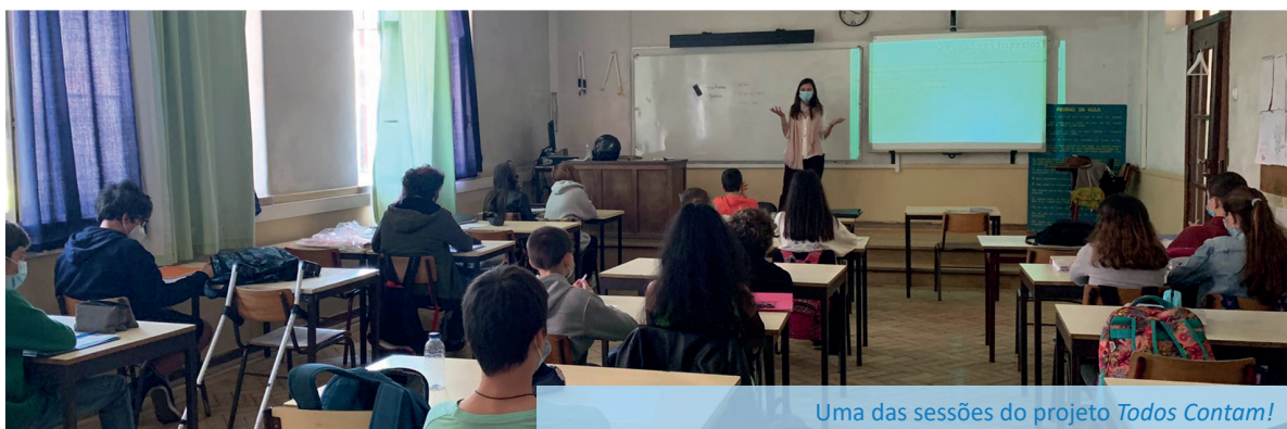
Uma das sessões do projeto Todos Contam!

Utilizando por base o Referencial Nacional de Educação Financeira, trabalhou-se com 13 instituições educativas num total de 50 ações de literacia financeira num modelo híbrido entre online e presencial. O projeto teve tanto sucesso entre voluntários e beneficiários que está já planeada uma segunda edição para o ano 2022.