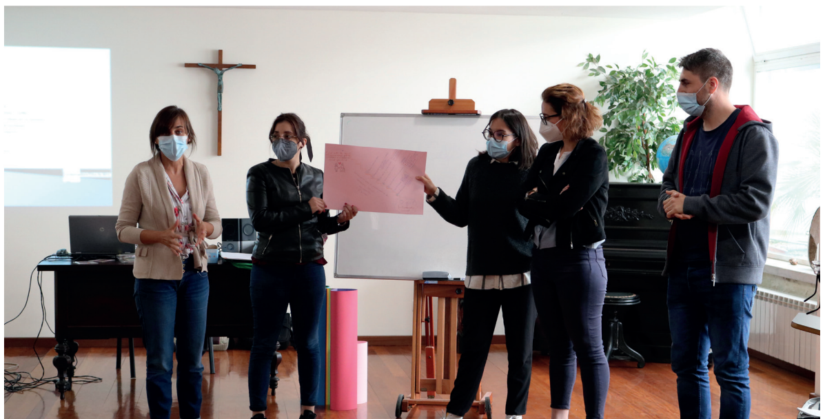
Elementos da Equipa Executiva e da Direção Social junto de um voluntário durante uma das formações organizadas

Foram mantidas relações de proximidade entre equipa executiva e direção social, promovendo trabalho conjunto principalmente após entrada de nova direção.