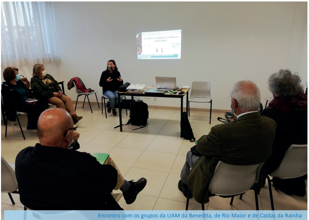
Encontro com os grupos da LIAM da Benedita, de Rio Maior e de Caldas da Rainha

Tendo por base o impacto das Campanhas da Família Espiritana nos seus beneficiários, a Solsef participou ativamente na sua dinamização junto dos grupos da LIAM, fazendo diversas visitas presenciais a reuniões de vários grupos.